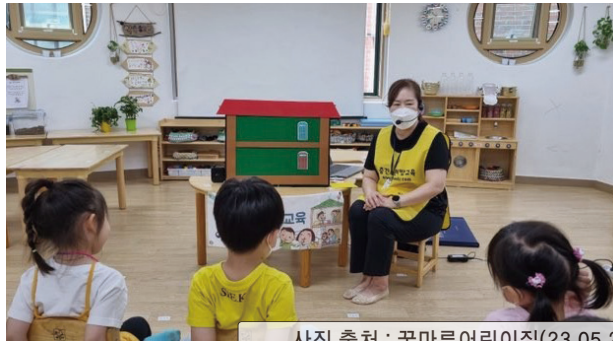
사진 출처 : 꿈마루어린이집(23.05.26)