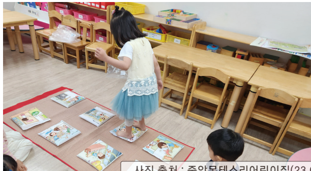
사진 출처 : 중앙몬테소리어린이집(23.05.31)