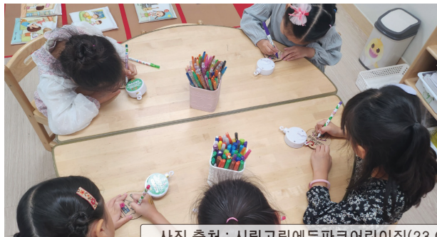
사진 출처 : 시립고림에듀파크어린이집(23.09.21)